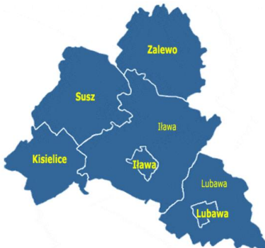
Rysunek 1. Położenie Gminy Iława na terenie powiatu iławskiego.