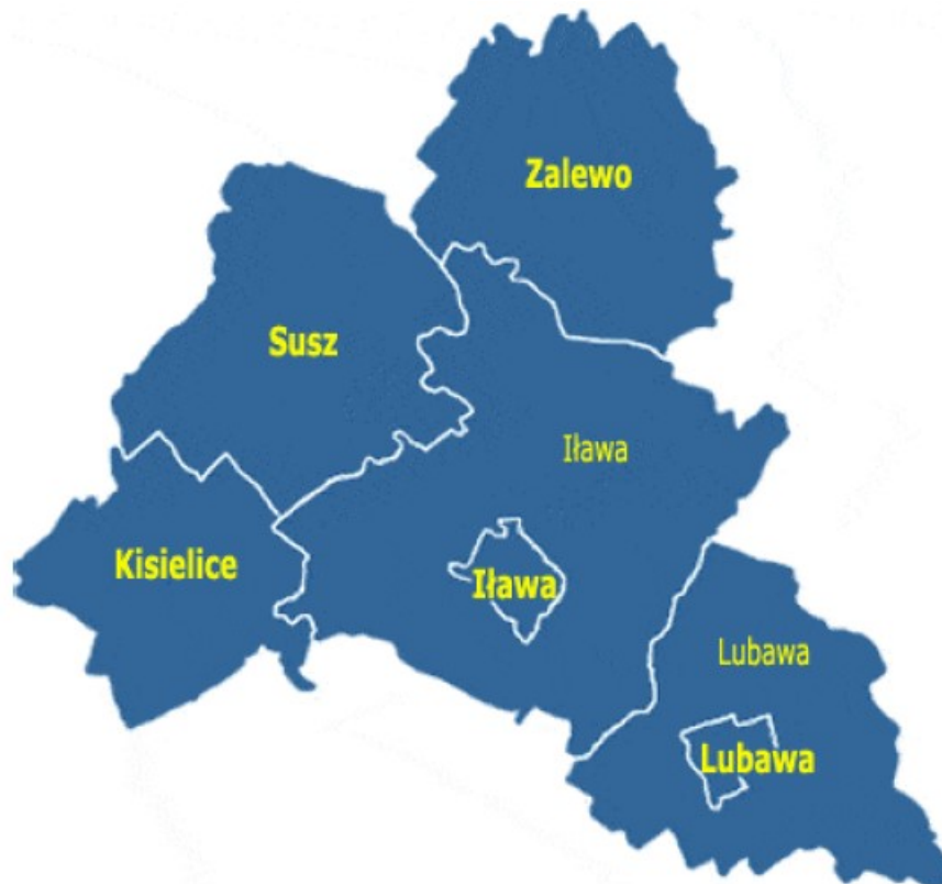
Rysunek 1. Położenie Gminy Iława na terenie powiatu iławskiego.

Gmina Iława położona jest w zachodniej części województwa warmińsko – mazurskiego, w powiecie iławskim. Powierzchnia gminy wynosi 178,72 km 2 . W jej skład wchodzi 76 miejscowości skupionych wokół 27 sołectw.