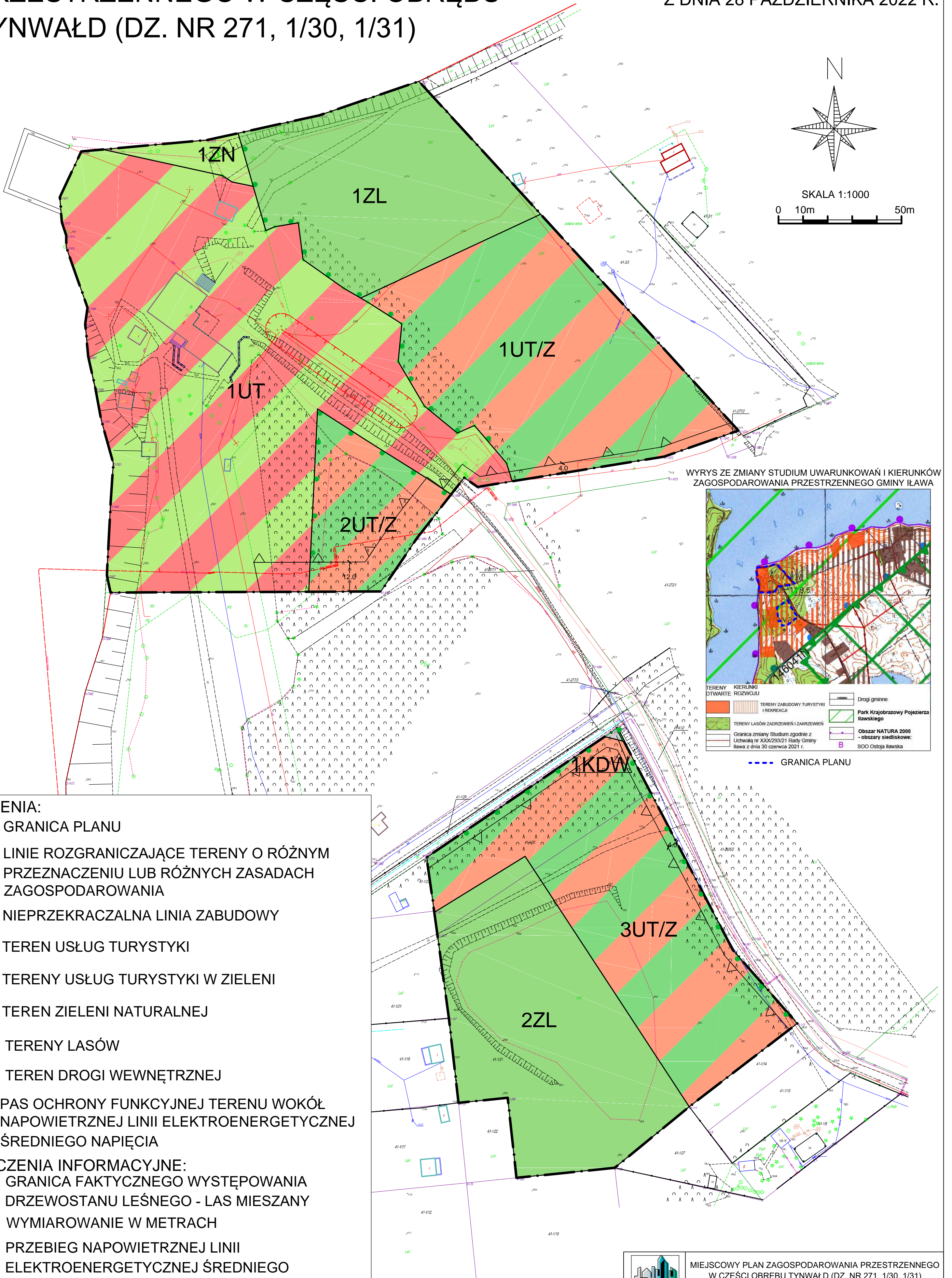
WYRYS ZE ZMIANY STUDIUM UWARUNKOWAŃ I KIERUNKÓW ZAGOSPODAROWANIA PRZESTRZENNEGO GMINY IŁAWA