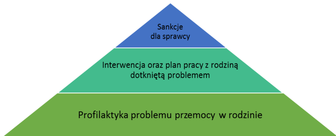
Rysunek 2. Metody oddziaływania na problem przemocy w rodzinie

Program przeciwdziałania przemocy w rodzinie oraz ochrony ofiar przemocy w rodzinie w Gminie Łława na lata 2017-2019 skierowany jest do ofiar przemocy w rodzinie, sprawców przemocy w rodzinie, świadków sytuacji przemocy, przedstawicieli instytucji, organizacji i służb zobowiązanych do udzielania pomocy rodzinie, a także do całej społeczności lokalnej. Wszystkie cele i działania zaplanowane do realizacji w ramach niniejszego Programu mają służyć poprawie sytuacji rodzin doznających przemocy domowej, jak i ochronie rodzin nią zagrożonych. Aby efektywnie zapobiegać problemowi oraz zwalczać niepożądane zachowania, konieczne jest wzmacnianie kompleksowości i spójności systemu wsparcia opartego o aktywizację i rozwój zasobów lokalnych, w tym zwłaszcza różnorodnych form profilaktyki oraz dostępu do specjalistów.